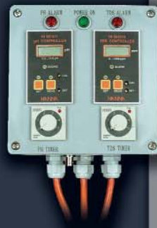
Panneaux de contrôle sur mesure