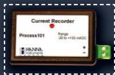
Emmagasineurs de données