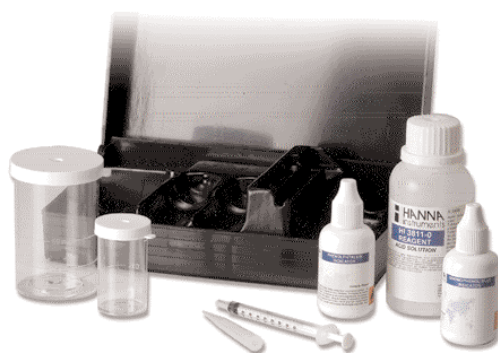
HI 3811 - Alcalinité