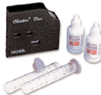
HI 3882 - pH Checker Disc®