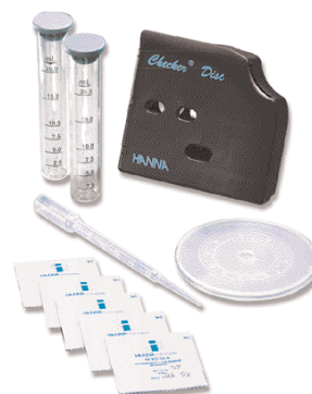
HI 38077 - Phosphate