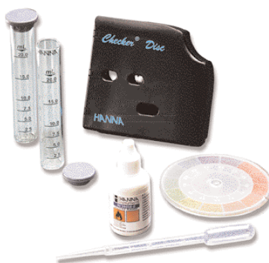
HI 38058 - pH