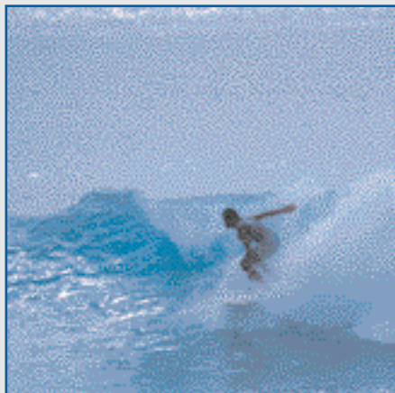
Contrôle de la qualité de l'eau