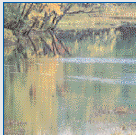
Par le passé, les eaux usées étaient évacuées directement dans les eaux naturelles, sans traitement.